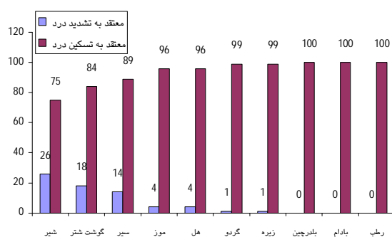
نمودار شماره 2 - درصد توزیع فراوانی بیماران معتقد که بیشتر اثرات تسکین‌دهنده را ذکر کرده‌اند