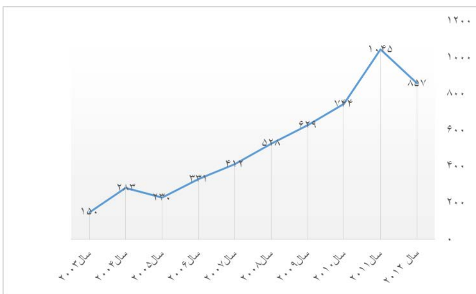
نمودار شماره ۱ - تولیدات علمی حوزه داروسازی و داروشناسی ایران بین سال‌های ۲۰۰۳ تا ۲۰۱۲